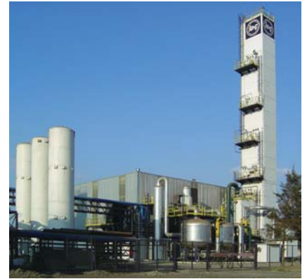
Impianto OxyGLASS 5000 – Turchia

SIAD Macchine Impianti ha innumerevoli Impianti Ossigeno attualmente funzionanti nel mondo. L'offerta di SIAD Macchine Impianti comprende inoltre - Servizio di Assistenza Post-Vendita e tele-controllo disponibile 7 giorni su 7 - Rete di Centri di Assistenza Autorizzati (C.A.A.) in tutti i continenti - Parti di ricambio disponibili a magazzino