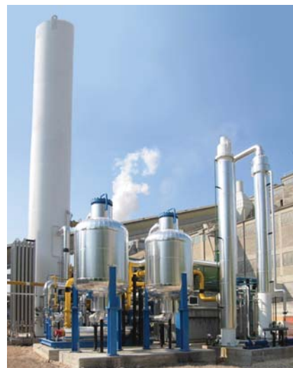
Impianto OxyGLASS 1500 - Italy

Trova l'elenco dei nostri Centri di Assistenza Autorizzati nel mondo visitando il nostro sito www.siadmi.com