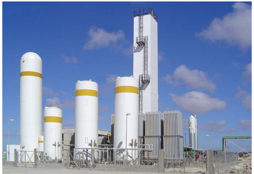
Impianto OxyGLASS 5000 - Marocco